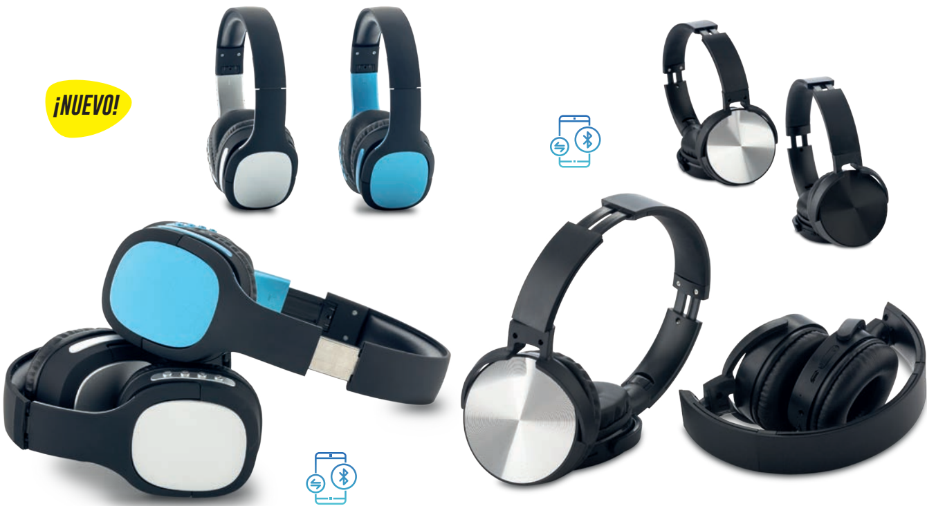
TE-345 / Audífonos Bluetooth Ribbon Audífonos Bluetooth plásticos tipo Headphone con auriculares acolchados. Bluetooth 4.2. Medidas: 7.5 cm x 19 cm Marca: 3.5 cm / Tampografía