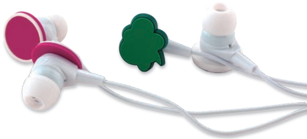
Audífonos Personalizados Audífonos con o sin micrófono, personalizables en PVC microinyectado de 18 x 18mm, cable de 1.1m de largo con conector Jack de 3.5mm, 105dB. Empaque en bolsa plástica o caja transparente con inserto full color.