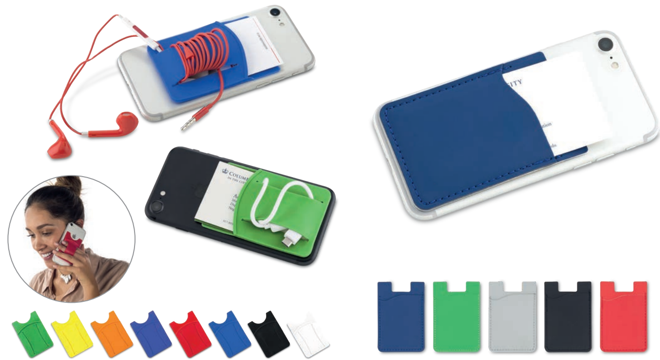
TE-187 / Portatarjetas con Organizador de Cables Portatarjetas adhesivo para móviles con organizador de cables. Medidas: 7.5 cm x 8.3 cm Marca: 2 cm / Tampografía en silicona a una tinta