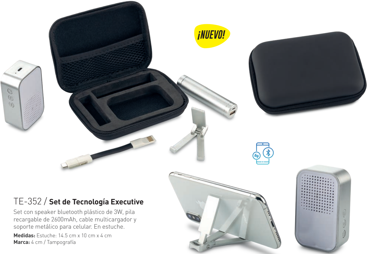
TE-352 / Set de Tecnología Executive Set con speaker bluetooth plástico de 3W, pila recargable de 2600mAh, cable multicargador y soporte metálico para celular. En estuche. Medidas: Estuche: 14.5 cm x 10 cm x 4 cm Marca: 4 cm / Tampografía