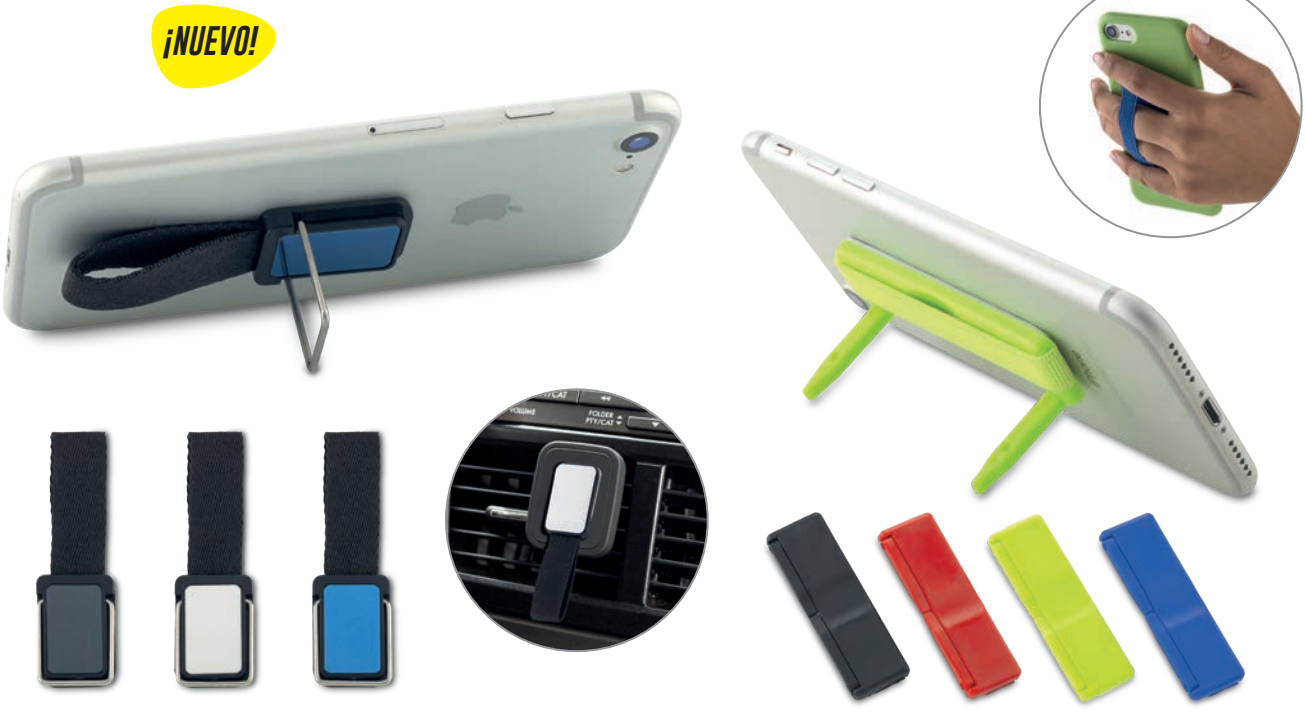
TE-325 / Soporte para Móviles Alert Metálico con agarradera. Para pegar en superficies lisas. Con clip metálico que funciona como soporte. Medidas: 7.2 cm x 2.3 cm Marca: 2.5 cm / Tampografía