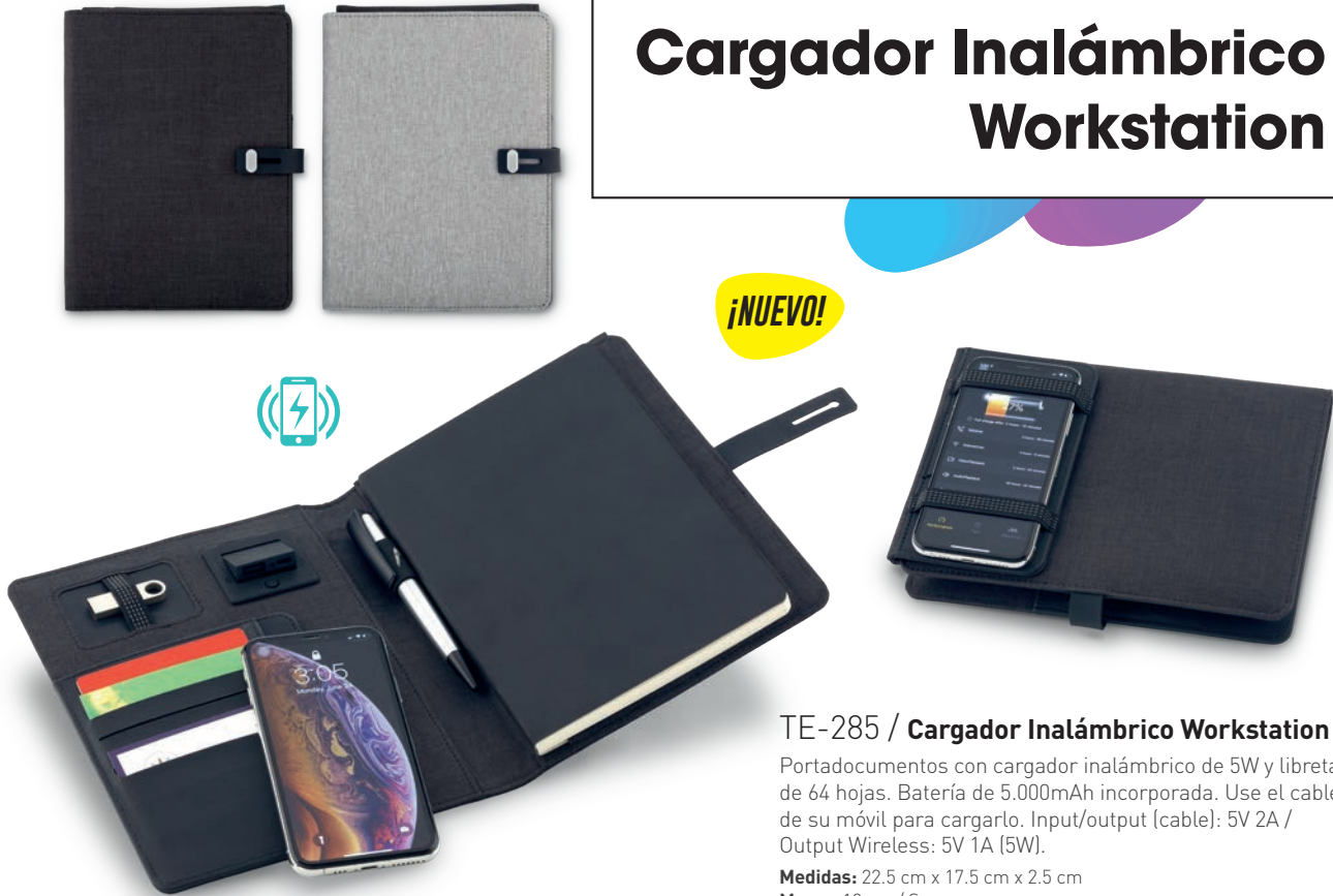
TE-285 / Cargador Inalámbrico Workstation Portadocumentos con cargador inalámbrico de 5W y libreta de 64 hojas. Batería de 5.000mAh incorporada. Use el cable de su móvil para cargarlo. Input/output (cable): 5V 2A / Output Wireless: 5V 1A (5W). Medidas: 22.5 cm x 17.5 cm x 2.5 cm Marca: 10 cm / Screen