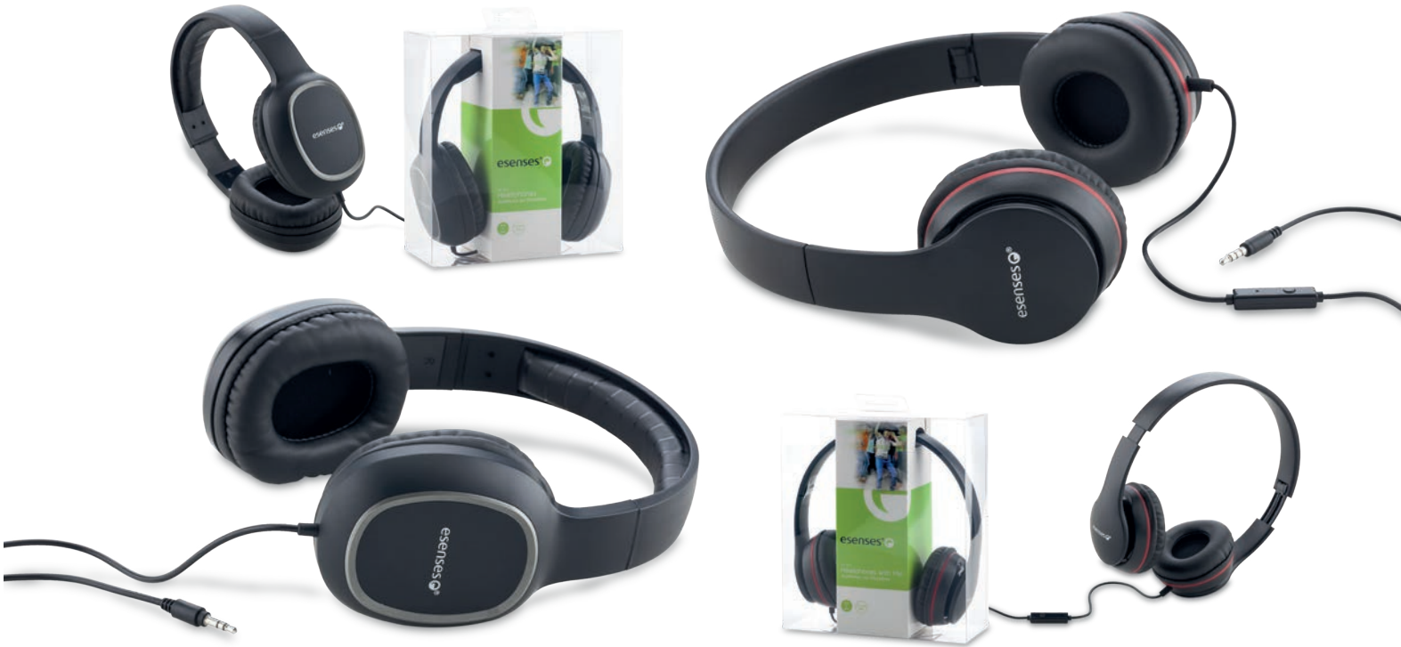
TE-229 / Audífonos Esenses Soft Audífonos plásticos de cable con diadema acolchada. Medidas: Caja blíster: 18.5 cm x 20 cm x 7.5 cm Sin Marca esenses