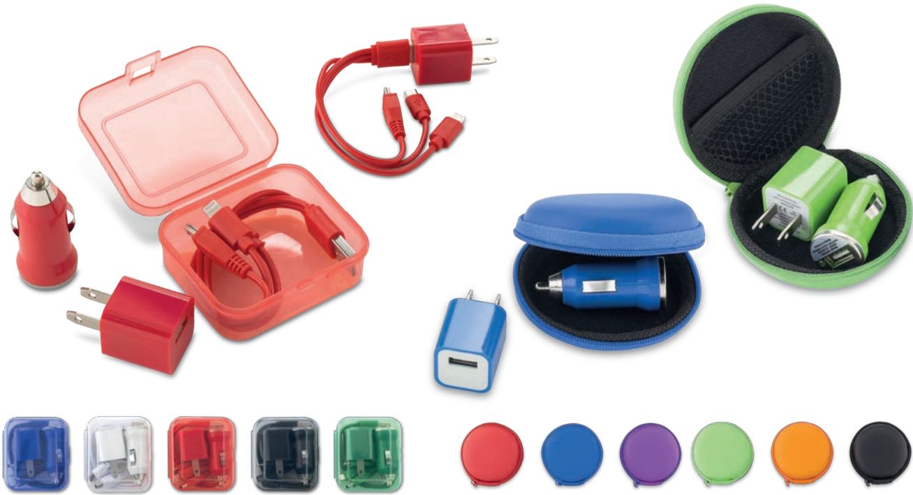
TE-246 / Set de Carga 3-1 Cable multicargador con entradas tipo C, iPhone y Micro. Incluye adaptador para carro y adaptador de pared. Medidas: Estuche: 7 cm x 6 cm x 3 cm Marca: 3.5 cm / Tampografía