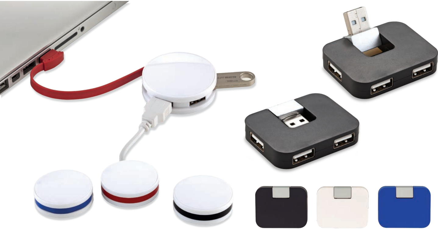
TE-99 / Puerto USB Einstein Puerto USB de 4 salidas. Medidas: 1.5 cm x 5 cm diámetro Marca: 2.5 cm / Tampografía