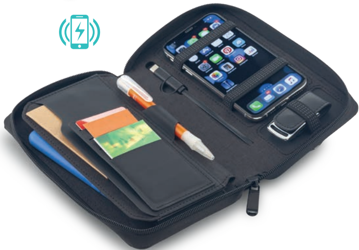
TE-277 / Cargador Inalámbrico Multiorganizador Cargador inalámbrico con folder anotador y pila recargable de 5000mAh con cable mini USB para cargar la pila. Con bolsillo portacelular interno. No incluye bolígrafo. Use el cable de su móvil para cargarlo. Input : 5V 1A Output (Inalámbrica) : 5V 1A , 5W / Output (Cable) : 5V 2.1A. Medidas: Cerrado: 17 cm x 22.5 cm Abierto: 22.5 cm x 36 cm Marca: 4 cm / Tampografía