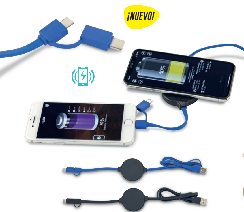
TE-333 / Cargador Inalámbrico con Cable Multicargador Mini cargador inalámbrico plástico de 5W con cable multicargador. Medidas: 0.8 cm x 5 cm diámetro Marca: 2 cm / Tampografía