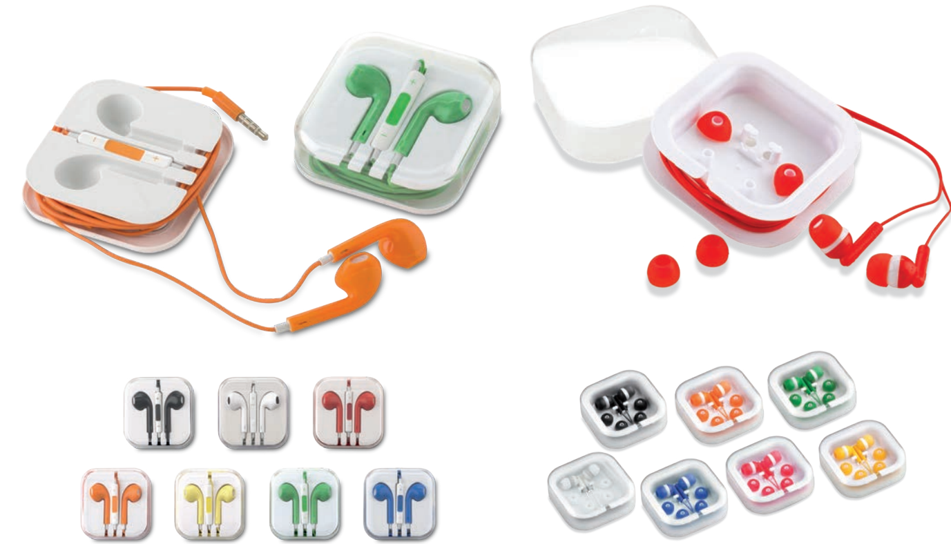
TE-151 / Audífonos Bowie con Manos Libres Audífonos plásticos en estuche con organizador de cable, funciona como manos libres (control de volumen compatible con IOS). Medidas: 6 cm x 6 cm x 2 cm Marca: 3.5 cm / Tampografía