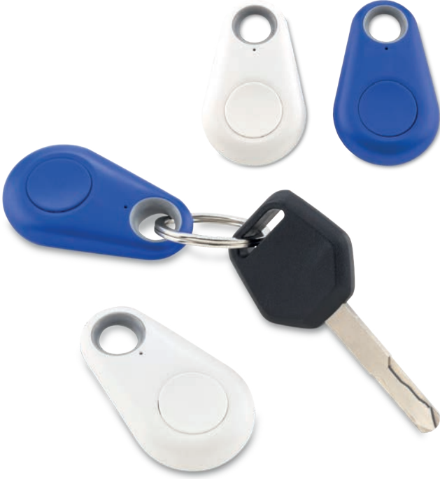
TE-178 / Localizador de Llaves Localizador de llaves Bluetooth, funciona con aplicación instalada en el smartphone. Alarma, grabador de voz y disparador remoto para selfies. Batería incluida. Medidas: 5 cm x 2.8 cm Marca: 1 cm / Tampografía