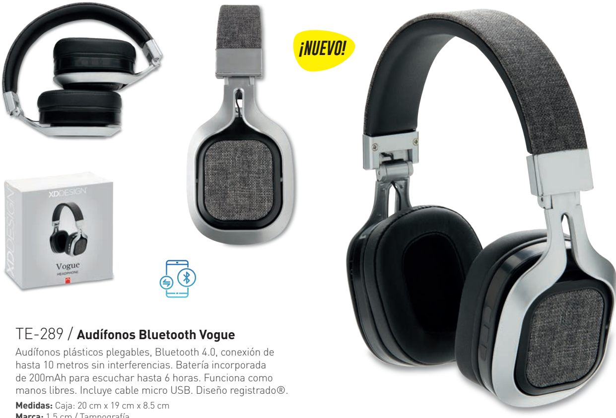
TE-289 / Audífonos Bluetooth Vogue Audífonos plásticos plegables, Bluetooth 4.0, conexión de hasta 10 metros sin interferencias. Batería incorporada de 200mAh para escuchar hasta 6 horas. Funciona como manos libres. Incluye cable micro USB. Diseño registrado®. Medidas: Caja: 20 cm x 19 cm x 8.5 cm Marca: 1.5 cm / Tampografía XDDESIGN®