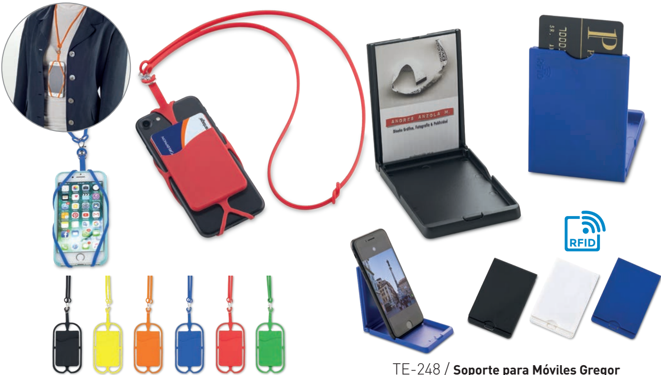
TE-184 / Portacelular 2 en 1 Silicone Portacelular en silicona con portatarjetas. Para usar en móviles de tamaño 16 cm x 8 cm máximo. Medidas: 7 cm x 12 cm Marca: 3.5 cm / Tampografía