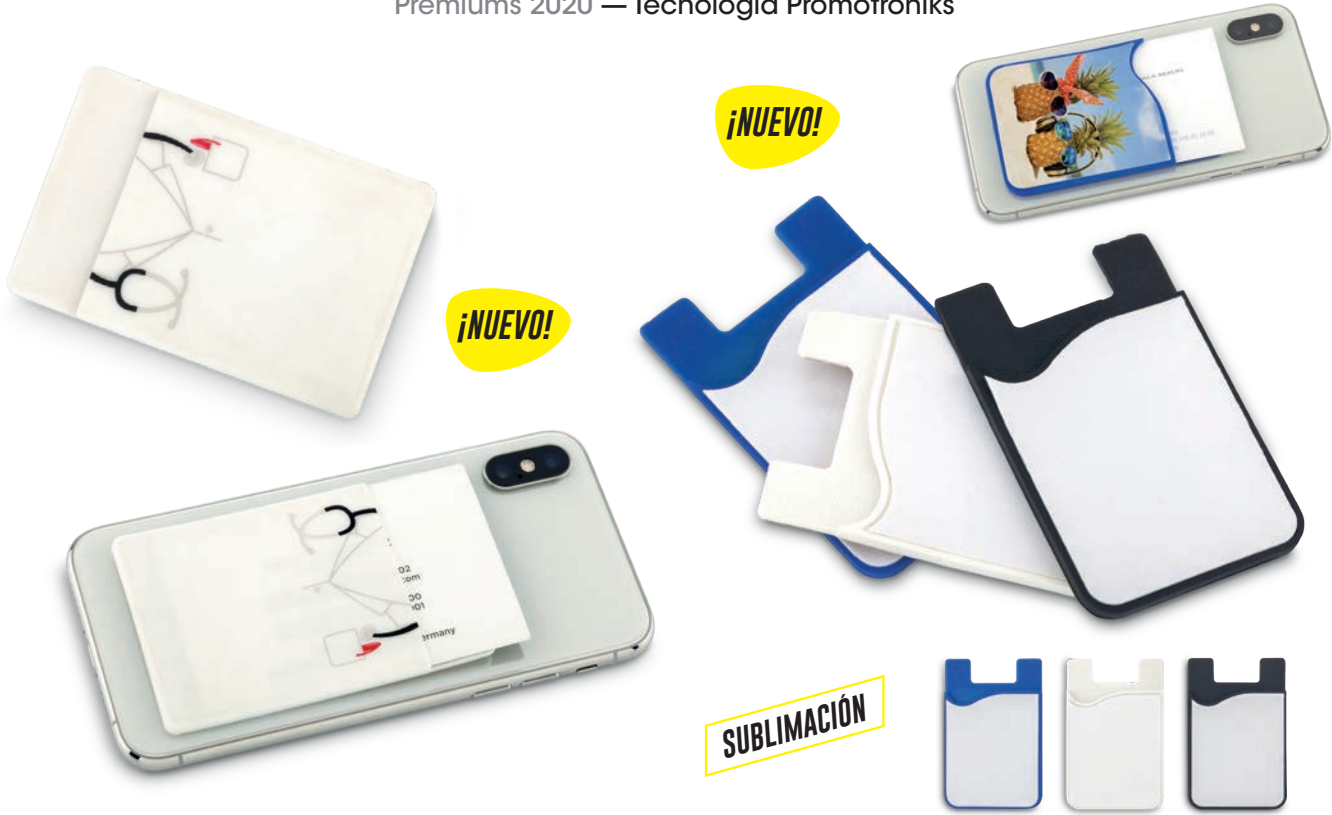
TE-294 / Portatarjetas en Silicona Doctor Portatarjetas adhesivo en silicona para móviles. Medidas: 8.7 cm x 5.7 cm Marca: 3 cm / Tampografía en Silicona