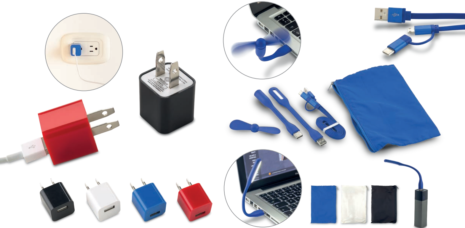
TE-278 / Adaptador USB de Pared Adaptador de pared para cable USB. Medidas: 2.6 cm x 2.3 cm x 2.6 cm Marca: 1 cm / Tampografía