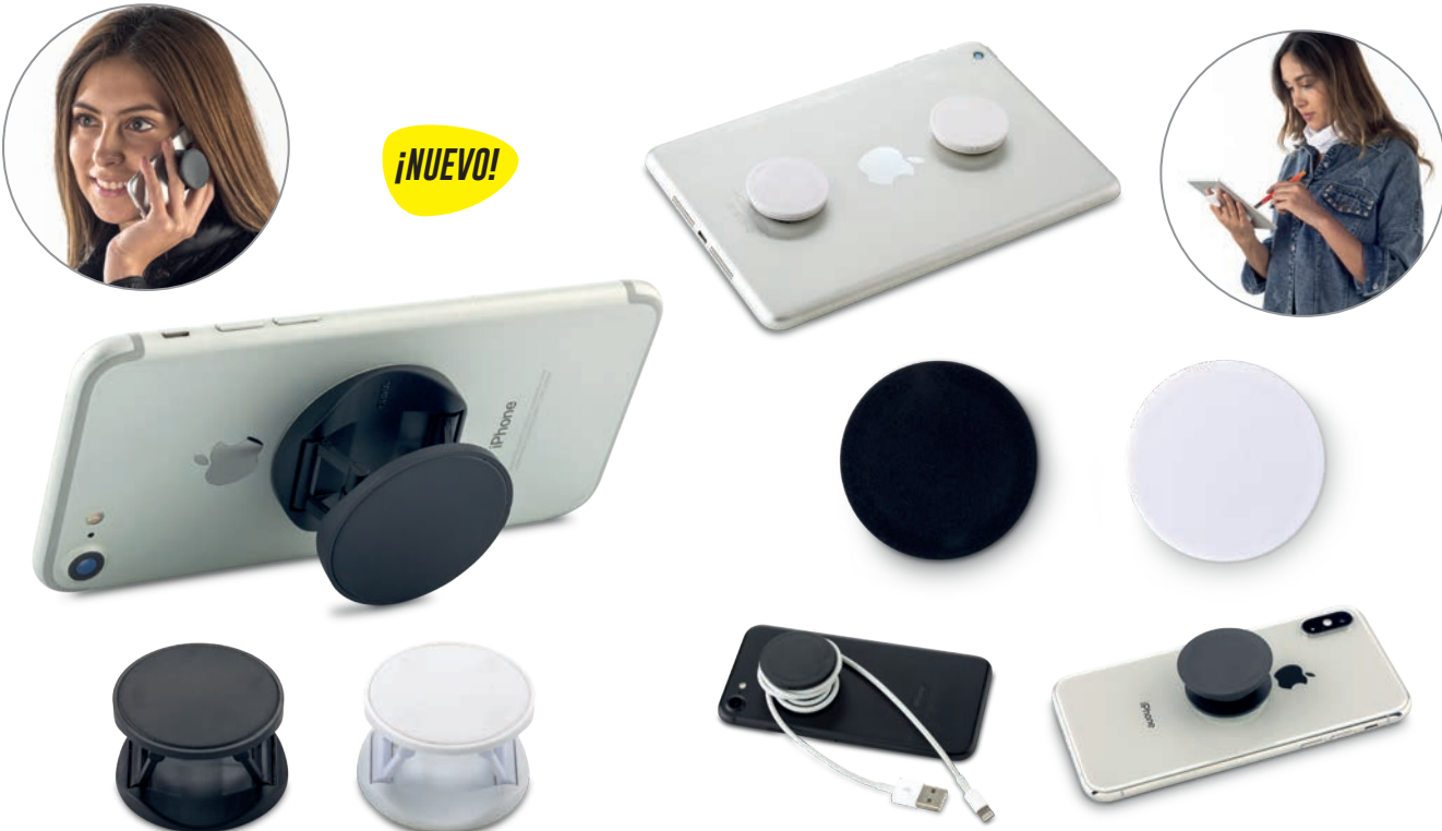
TE-317 / Soporte para Móviles Foldy Soporte plástico expandible para celulares. Medidas: 0.9 cm x 4.3 cm diámetro Marca: 4.3 cm / Impresión digital full color sobre rígidos (Color Blanco únicamente) / Litoresina a partir de 300 unidades / 2.5 cm / Tampografía