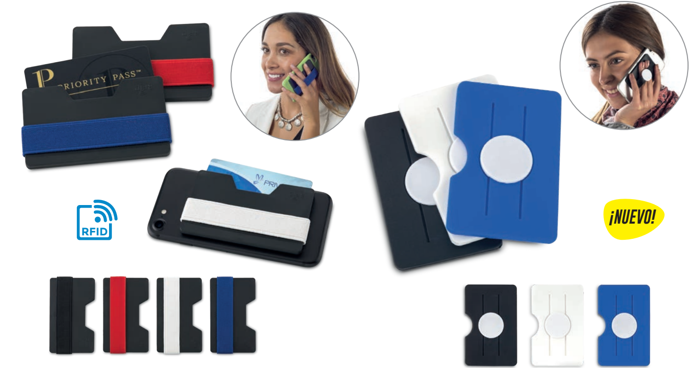
TE-265 / Soporte para Móviles 2-1 Elastic Plástico. Su material interno permite bloquear las señales electromagnéticas RFID (Radio Frequency Identification) que se usan en tarjetas de chip, tarjetas electrónicas de transporte, etc. Medidas: 9.4 cm x 5.6 cm Marca: 5 cm / Tampografía