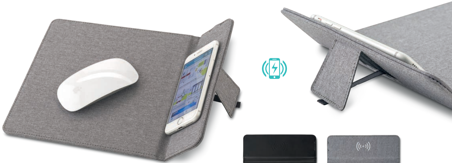
VA-792 / Mouse Pad con Cargador Inalámbrico Con cargador inalámbrico y soporte para celular lateral. Input: 5V / 1.5A. Output: 5V / 0.8A. Medidas: 29.5 cm x 21.8 cm Marca: 15 cm / Screen