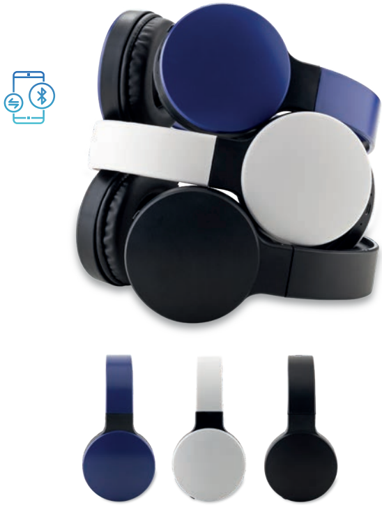
TE-165 / Audífonos Bluetooth Barrett Audífonos Bluetooth plásticos tipo Headphone con auriculares y diadema acolchados. Medidas: 19 cm x 16 cm Marca: 5 cm / Tampografía