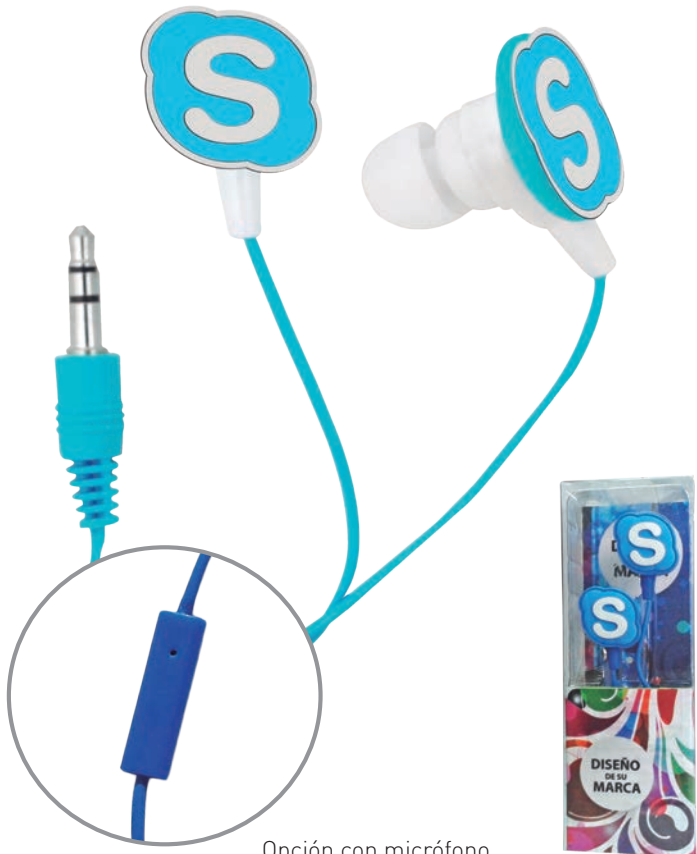
Opción con micrófono (Manos Libres)