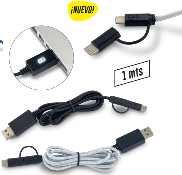
TE-319 / Cable Multicargador Light Up Cable multicargador. Entrada iPhone-Micro (2 en 1) y Tipo C. Base luminosa (puede ver el logo al hacerlo en láser). Medidas: 1 metro Marca: 2 cm / Tampografía / 1.5 cm / Láser