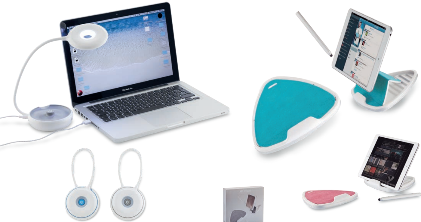
TE-196 / Lámpara USB Desk Con botón de apagado dimerizable. Funciona con 3 baterías AA (no incluidas) y/o conexión a puerto USB. Medidas: Cerrado: 4.3 cm x 11 cm diámetro Marca: 2.5 cm / Tampografía