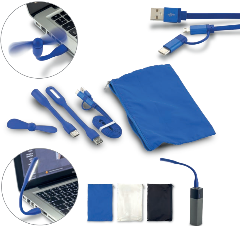
TE-171-1 / Set de Tecnología Station II Set de mini lámpara flexible, ventilador USB y cable de carga micro USB 2-1 y tipo C en estuche de poliéster 210D con cremallera. Medidas: 18.5 cm x 12 cm Marca: 10 cm / Screen