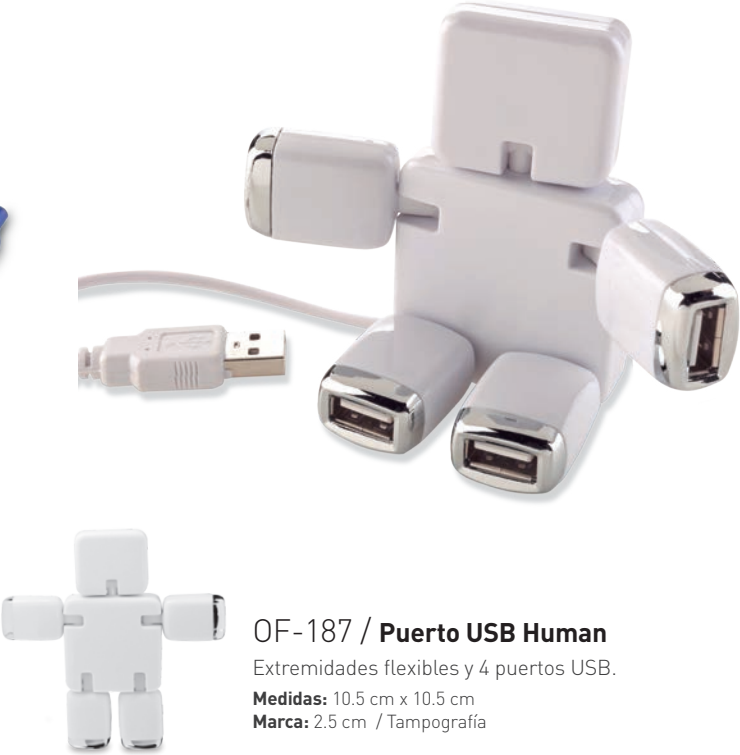
OF-187 / Puerto USB Human Extremidades flexibles y 4 puertos USB. Medidas: 10.5 cm x 10.5 cm Marca: 2.5 cm / Tampografía