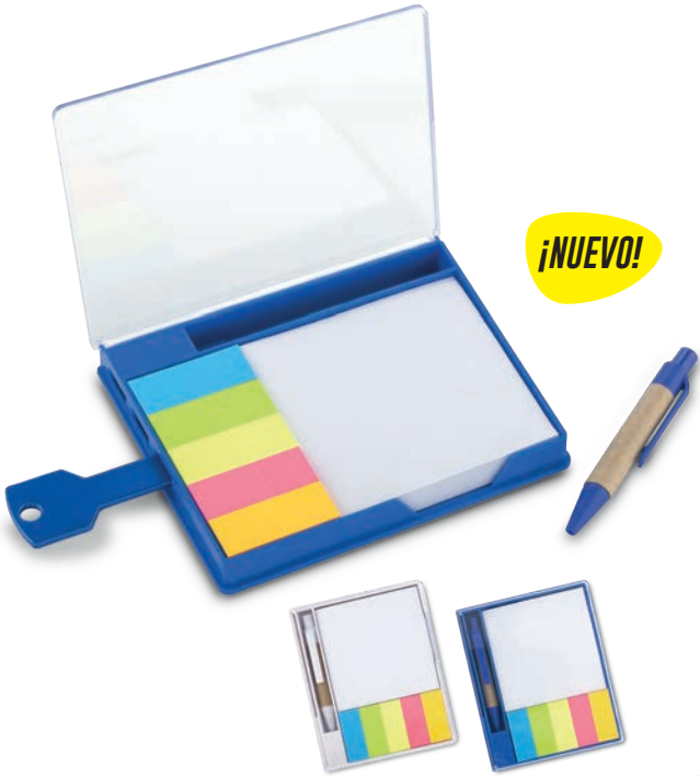
TE-327 / Sticky Set con Puerto USB Set de plástico con 5 stickies, bolígrafo, bloc de notas y tres puertos USB. Medidas: 12 cm x 9.8 cm x 1.7 cm Marca: 5 cm / Tampografía