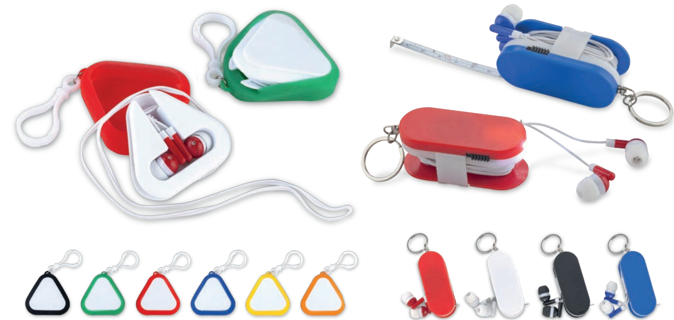
TE-144 / Audífonos Triángulo Audífonos plásticos con organizador de cable y tapa en silicona. Con carabinero. Medidas: 6 cm x 6 cm x 1.4 cm Marca: 3 cm / Tampografía