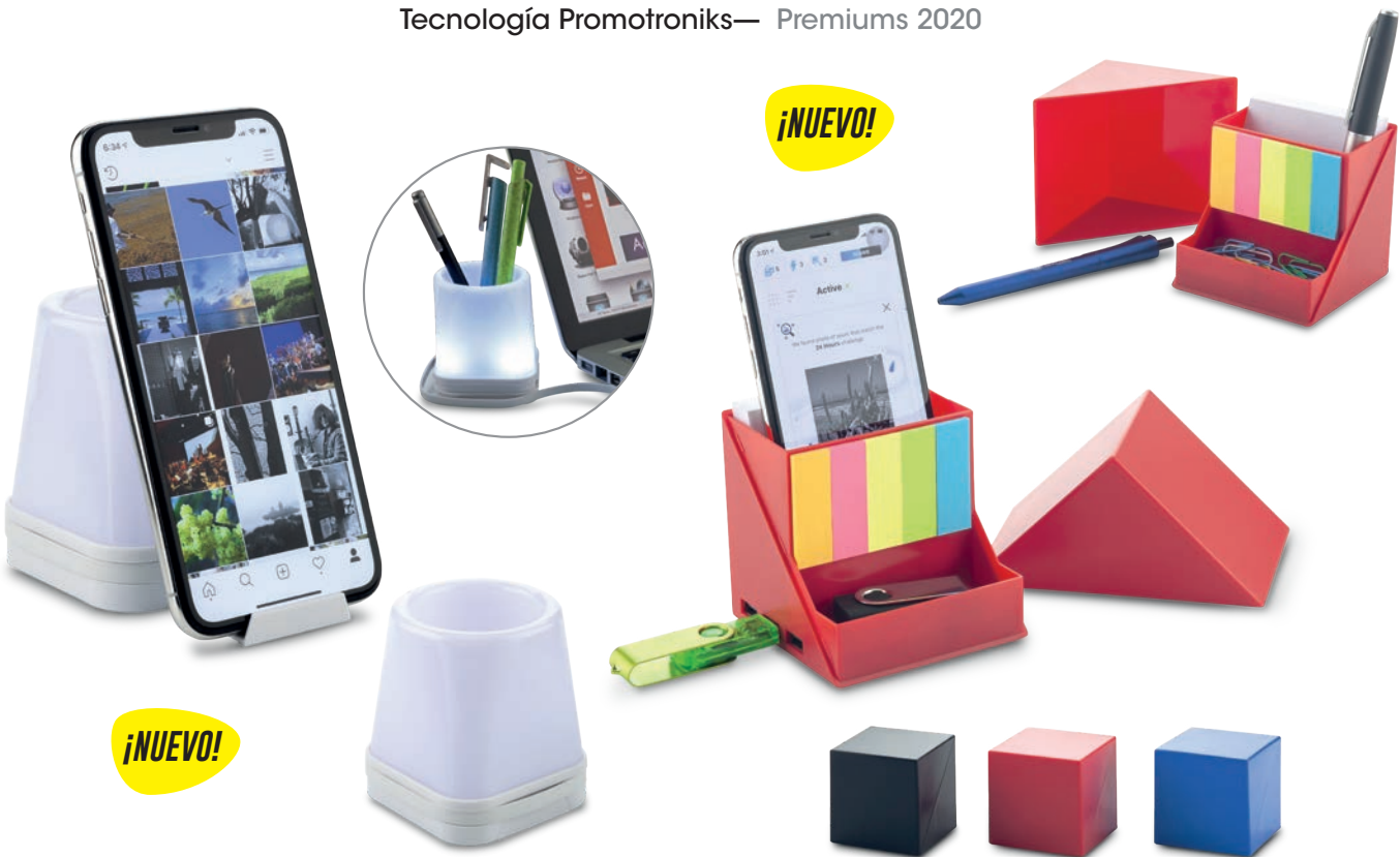
TE-348 / Portabolígrafos con Puertos USB Belind Portabolígrafos plástico con luz led 4 puertos USB 2.0 y soporte para móviles. Medidas: 6.9 cm x 6.9 cm x 8 cm Marca: 2 cm / Tampografía