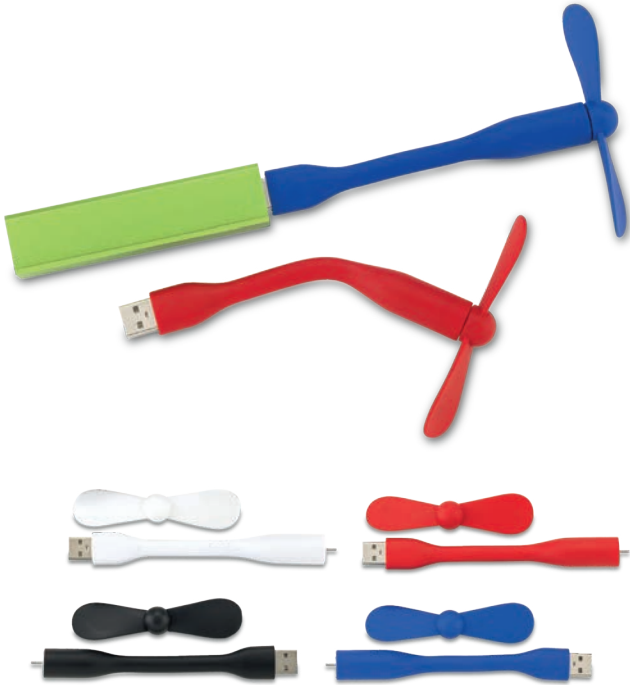
VA-600 / Ventilador USB Handy Ventilador USB flexible de 2 aspas. Funciona con pilas recargables (Powerbank) y productos con entrada USB. Medidas: 14.5 cm x 9 cm Marca: 3 cm / Tampografía