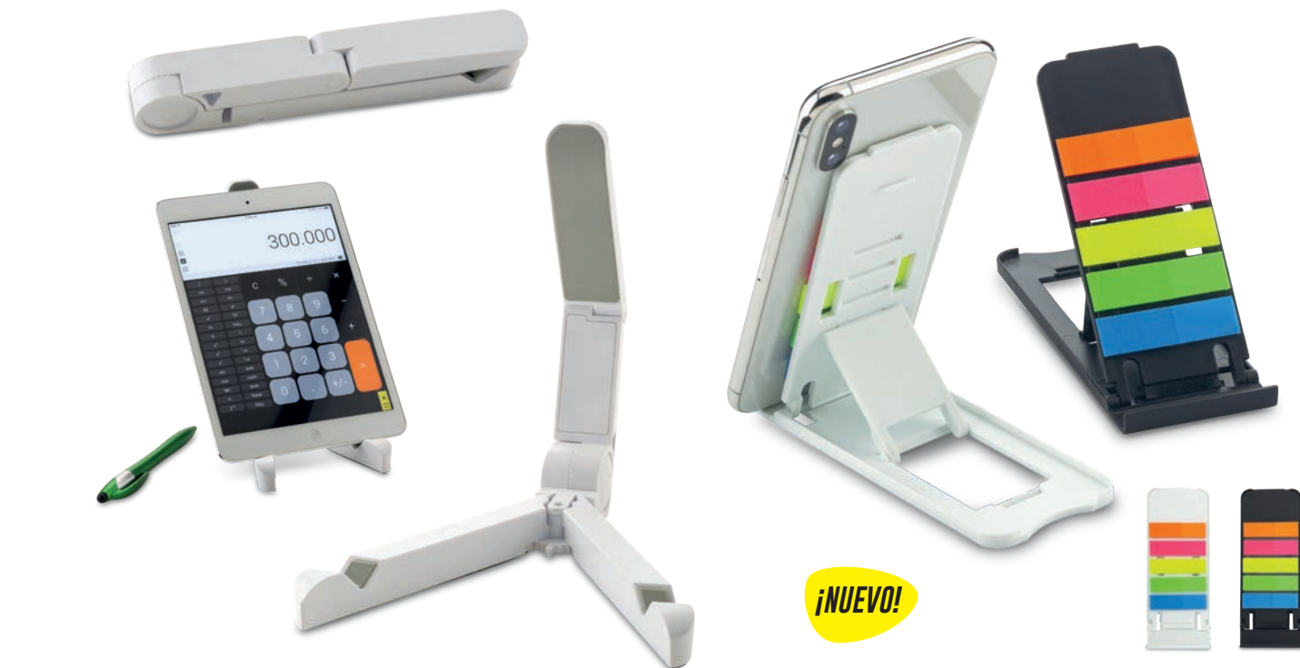
TE-252 / Soporte para Tablets Soporte plástico para tablet. Antideslizante y ajustable. Medidas: Cerrado: 18.4 cm x 3 cm x 2.3 cm Marca: 3.5 cm / Tampografía