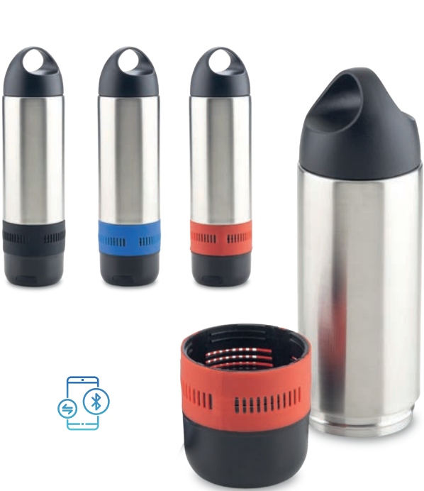
MU-149 / Botilito Metálico Sporty 350ml con Speaker Botilito en acero inoxidable doble pared con speaker bluetooth de 3W. Medidas: 26.5 cm x 6.5 cm diámetro Marca: 4 cm / Láser (Líquido Oxidante)